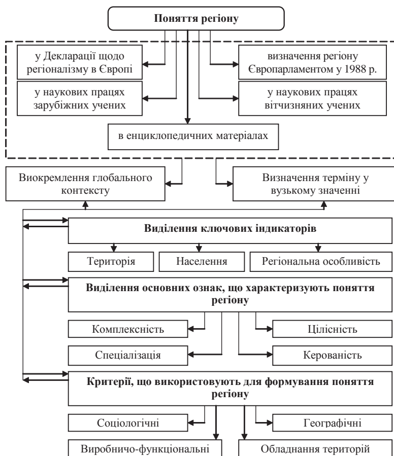
Рис. 2. Основні ознаки, критерії та ключові індикатори у визначенні поняття регіону

У вузькому значенні, одні дослідники пропонують визначати регіон як господарсько-економічну спільність (наприклад, український Донбас, німецький Рур, американський Середній Захід, російський Волго-В'ятський регіон тощо), інші — як географічно-адміністративну одиницю (область — в Україні, земля — у Німеччині, штат — у США, воєводство — у Польщі тощо), треті як культурно-історичну територію (Буковина, Гуцульщина, Поділля — в Україні, Нова Англія — у США тощо) [6; 7; 8 та ін.].