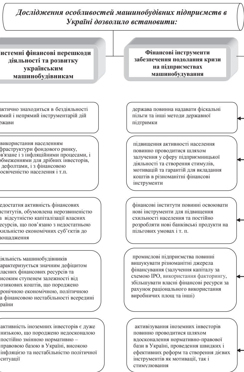
Рис. 2. Фінансові перешкоди діяльності та розвитку і вдосконалені фінансові інструменти забезпечення подолання кризи на підприємствах машинобудування

8. Герчикова И.Н. Финансовый менеджмент: учебное пособие / И.Н. Герчикова. — М.: Изд. АО "Консалтбанкир", 2006. — 275 с.