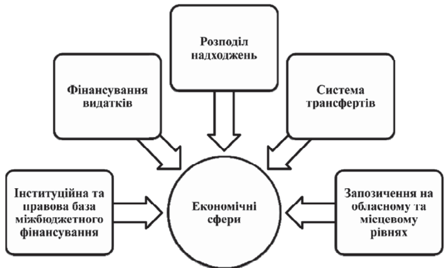
Рис. 3. Економічні сфери, у яких Україна повинна докласти зусиль для підвищення ефективності існуючої моделі міжбюджетних відносин

Реалізація зазначених заходів та врахування досвіду економічно розвинених країн неодмінно сприятиме зміцненню фінансових основ діяльності органів місцевого самоврядування регіонів України, забезпечить стабільний соціально-економічний розвиток територій, підвищення соціального захисту та добробуту громадян. Тоб-