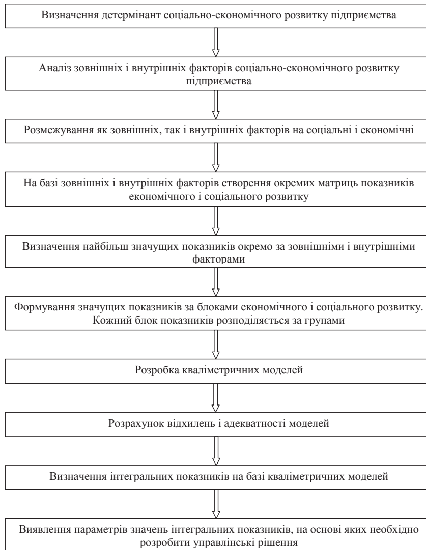
Рис. 1. Етапи методики оцінки стану і динаміки соціально-економічного розвитку підприємства

основних функцій, до яких належать: планування, організація, мотивація, контроль, регулювання. Якість управління залежить від якості здійснення функцій. Найважливіша функція управління — це контроль. Побудова системи контролю є необхідною умовою успішного функціонування і розвитку підприємства. Для побудови системи контролю слід визначити основні проблемні аспекти, з якими стикається підприємство, його стан і динаміку розвитку. А отже, набуває актуальності проблема розробки економіко-математичної моделі на основі якої буде можливість приймати ефективні управлінські рішення.