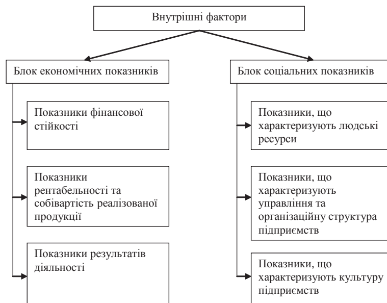
Рис. 4. Визначення найбільш значущих показників соціально-економічного розвитку підприємства за внутрішніми факторами