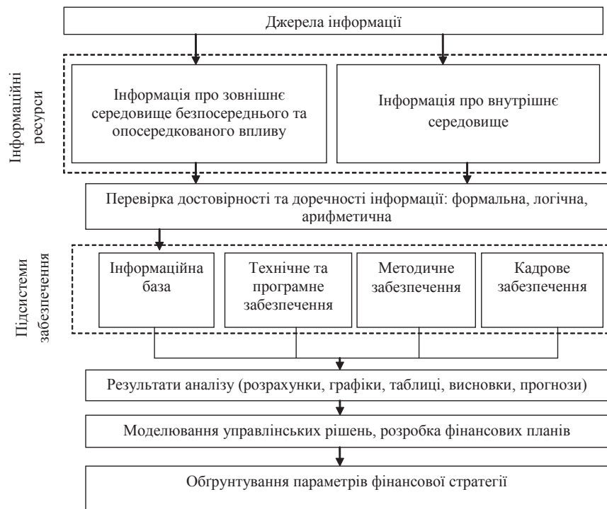
Рис. 1. Алгоритм процесу інформаційного забезпечення розробки фінансової стратегії підприємства