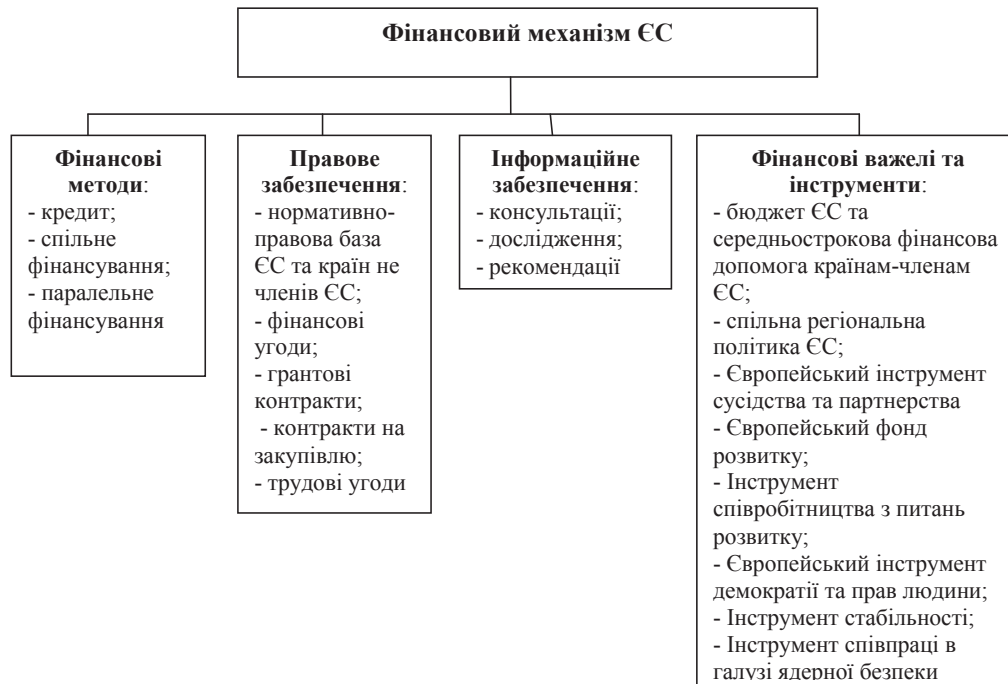
Рис. 1. Механізм управління фінансами ЄС

Джерело: складено автором на основі [9].