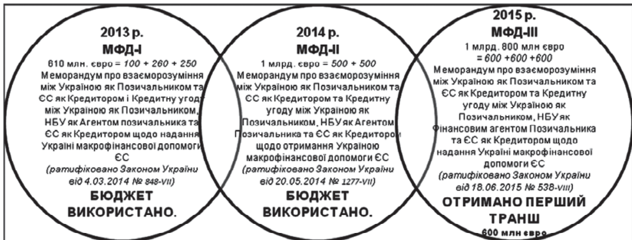
Рис. 3. Програми макрофінансової допомоги ЄС