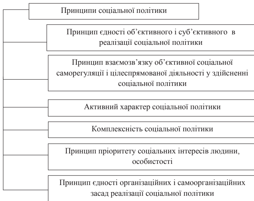
Рис. 3. Принципи соціальної політики

О.В. Радченко, І.Г. Савченко. — Х.: Вид-во ХНУВС, 2008. — 200 с.