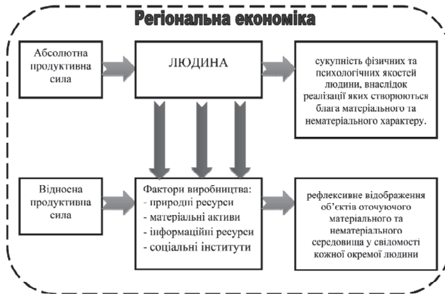
Рис. 1. Абсолютні та відносні продуктивні сили в регіональній економіці