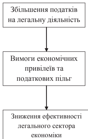
Рис. 2. Наслідки хибного кола позалегалності