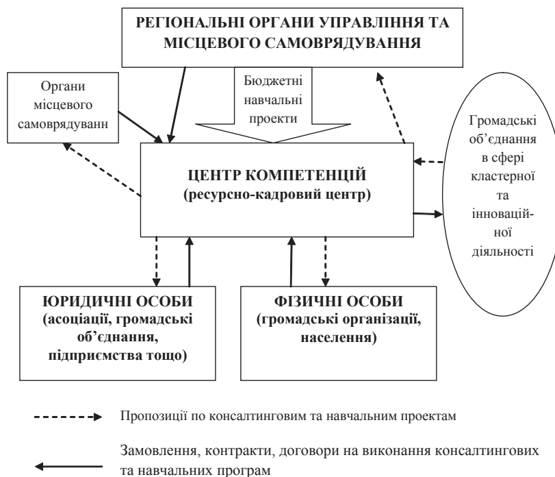
Рис. 2. Принципова схема організації функціонування Центру компетенцій