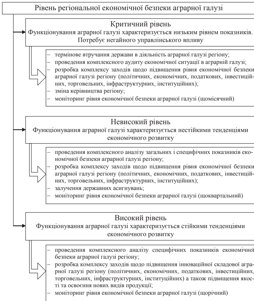
Рис. 1. Організаційно-управлінський механізм прийняття рішень щодо забезпечення регіональної економічної безпеки аграрної галузі