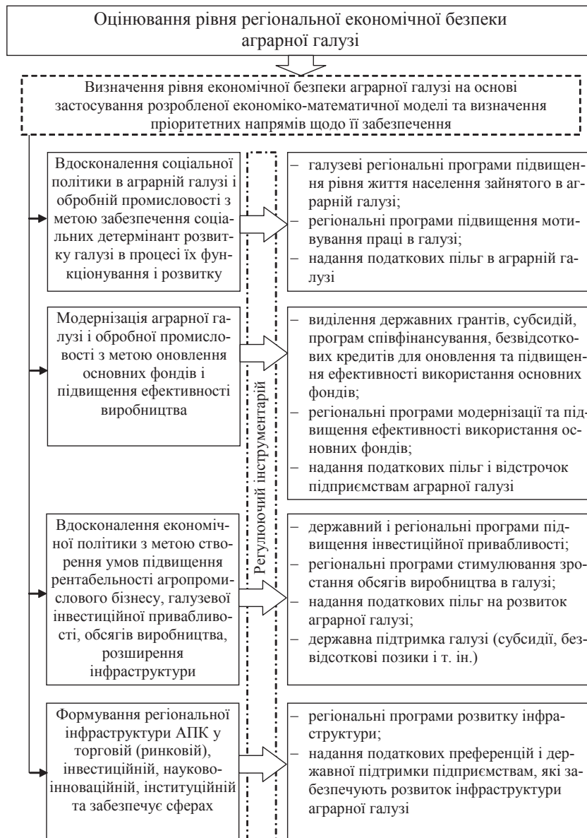
Рис. 2. Інструментарій державної аграрної політики забезпечення регіональної економічної безпеки аграрної галузі

науково-інноваційної складової регіонального агропромислового комплексу; інші види інструментарію, що не суперечать чинному законодавству.