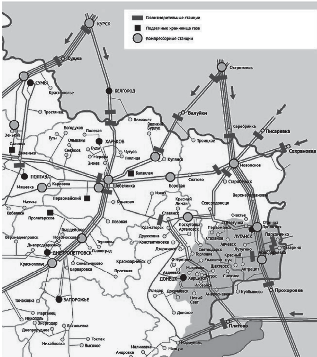
Рис. 2. Газотранспортна система східної України

ганської області також припинено. Відносна економічна життєздатність досліджуваних територій визначається наявністю протяжної лінії кордону з Російською Федерацією, а також розвинутою інфраструктурою, що зв'язувала населені пункти і промислові центри Луганської (Ворошиловградської), Донецької та Ростовської областей СРСР. На території окремих районів Донецької та Луганської областей знаходяться 6 міжнародних автомобільних пропускних пунктів (МАПП). В окремих районах Луганської області знаходяться МАПП Изварине — Донецьк, Червонопартизанськ — Гуково, Должанський — Новошахтинськ. В окремих районах Донецької області знаходяться МАПП Весело-Вознесенка — Новоазовськ, Куйбишеве-Маринівка, Матвеев Курган — Успенка. Через зазначені МАПП здійснюється пасажирське легкове і ав-