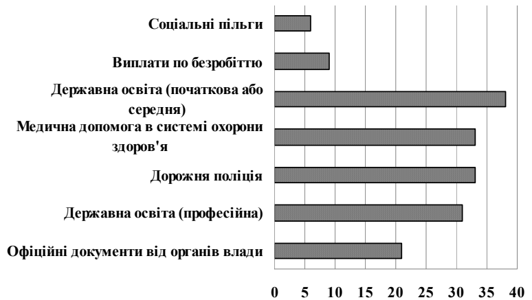
Рис. 3. Хабарі при взаємодії з органами влади, 2016 р.