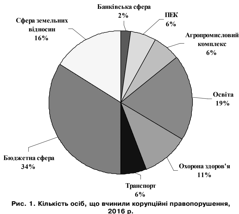
Рис. 1. Кількість осіб, що вчинили корупційні правопорушення, 2016 р.