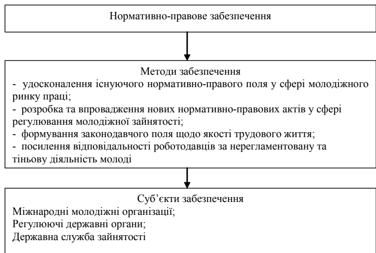
Рис. 1. Нормативно-правове забезпечення зайнятості молоді на ринку праці

1. Частка молоді, яка не працює і не навчається (NEET — proportion of young people neither in employment nor in education or training). Цей показник включає в себе молодих людей, які є економічно неактивними не через навчання в учбових закладах (до таких належать особи, які втратили