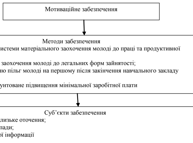
Рис. 3. Напрями мотиваційного забезпечення зайнятості та конкурентоспроможності молоді на ринку праці

2. Грішнова О. Нові підходи до мотивації праці з урахуванням системи життєвих цінностей молоді / О. Гріш-