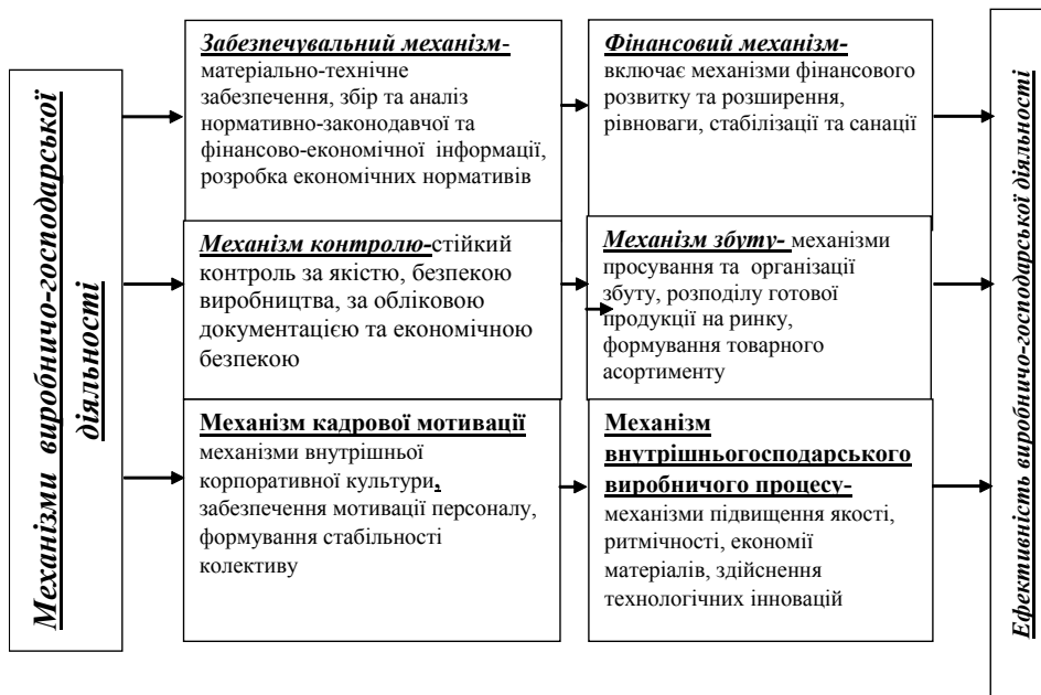
Рис. 2. Механізми управління виробничо-господарською діяльністю аграрних підприємств

За рахунок функціонування механізмів збуту сільськогосподарської продукції відбувається коригування усіх процесів виробничо-господарської діяль-