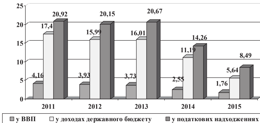
Рис. 1. Частка надходжень податку на прибуток підприємств у ВВП, доходах та податкових надходженнях державного бюджету України, %