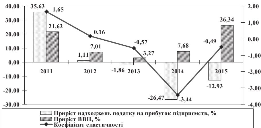
Рис. 2. Динаміка коефіцієнта еластичності податку на прибуток підприємств за 2011–2015 рр.