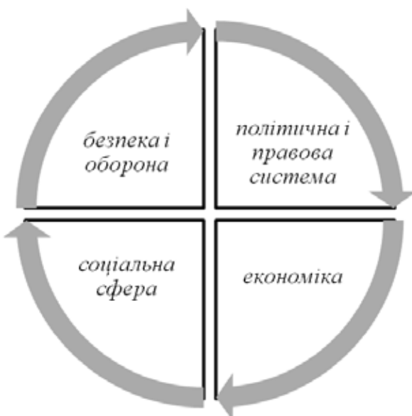
Рис. 1. Об'єкти постконфліктного відновлення

Зміст постконфліктного відновлення полягає у складній системі взаємозв'язку його суб'єктів та об'єктів, що ґрунтуються на певних принципах, та спрямованій на досягнення конкретних цілей в зовнішньому середовищі. Такий підхід передбачає конкретизацію елементів такої системи та оптимізацію взаємодії між ними, що забезпечить більш ефективне її функціонування.