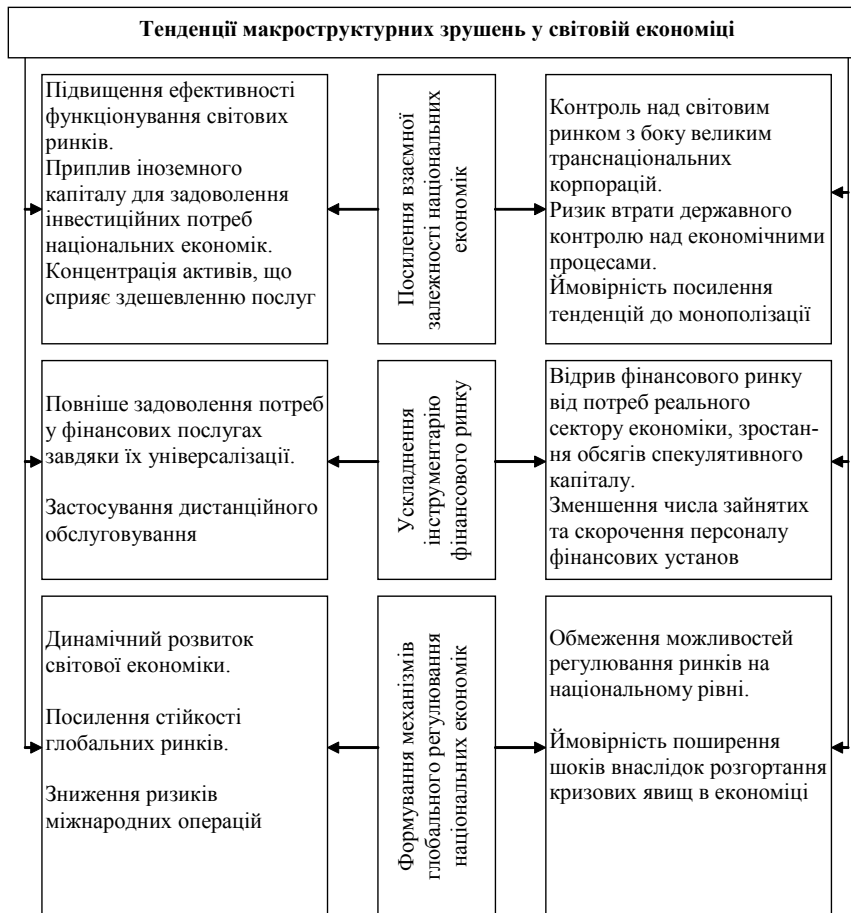
Рис. 1. Визначальні тенденції макроструктурних зрушень у світовій економіці