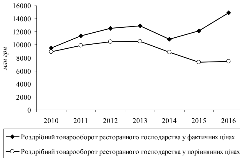
Рис. 2. Динаміка обсягів роздрібного товарообороту ресторанного господарства в Україні протягом 2010—2016 рр. у фактичних та порівнянних цінах (2010=1)

Дані за 2014—2016 рр. без урахування тимчасово окупованої території АР Крим, м. Севастополя та частини зони проведення антитерористичної операції. Дані за 2015—2016 рр. власний прогноз, що побудовано на основі даних Державної служби статистики України про витрати домогосподарств на харчування поза домом та дані про індекс цін за 2015—2016 рр. на продовольчі товари у торговій мережі.