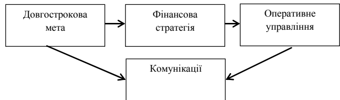
Рис. 1. Місце фінансової стратегії у загальній стратегії девелоперської компанії

Фінансова стратегія повинна відповідати рівню ділового ризику і потребам фінансування бізнес-плану, повинна розглядати фінансові цілі девелоперської компанії, потреби фінансування, дивідендну політику і ринкові умови. Фінансова стратегія не однакова для всіх підприємств і залежить від розмірів девелоперської компанії, стадії його розвитку, сфери діяльності, фінансового стану, обсягу наявних ресурсів.