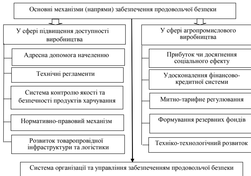
Рис. 4. Механізм забезпечення продовольчої безпеки

відуальному підходу, але і стимулювати їх розвивати власну збутову інфраструктуру, що допоможе позбавитись від посередників у сільському господарстві та наблизитись до світових моделей розвитку агропромислового комплексу [14].