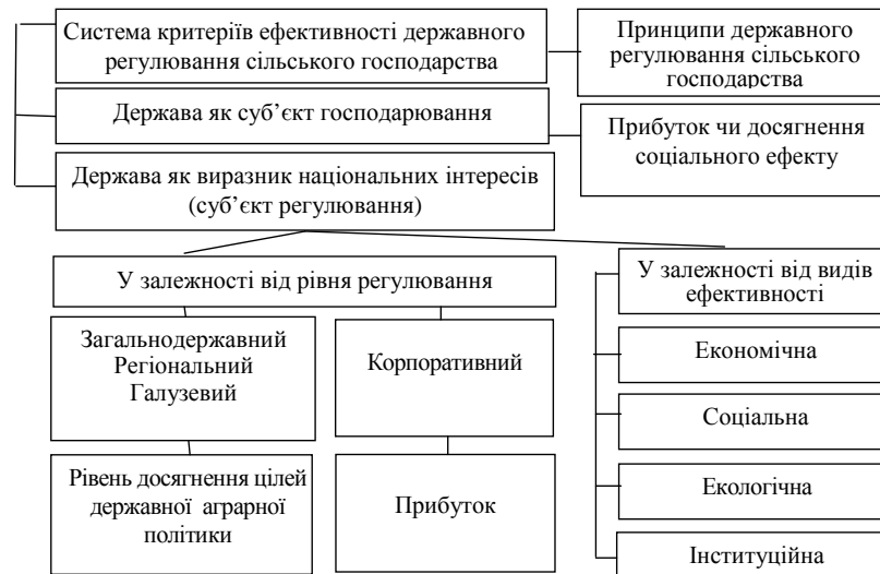
Рис. 2. Система вибору інструментів державного регулювання сільського господарства України

K_{\text{нп}} — чисельність сільського населення у працездатному віці, осіб. — Рівень соціальної підтримки сільського населення ( P_c ):