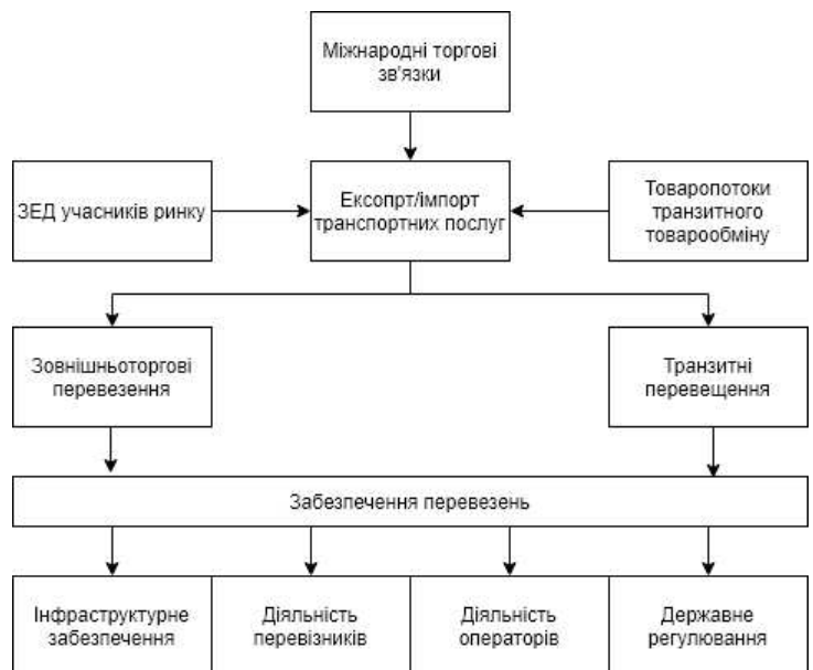
Рис. 2. Формування системи експорту/імпорту транспортних послуг