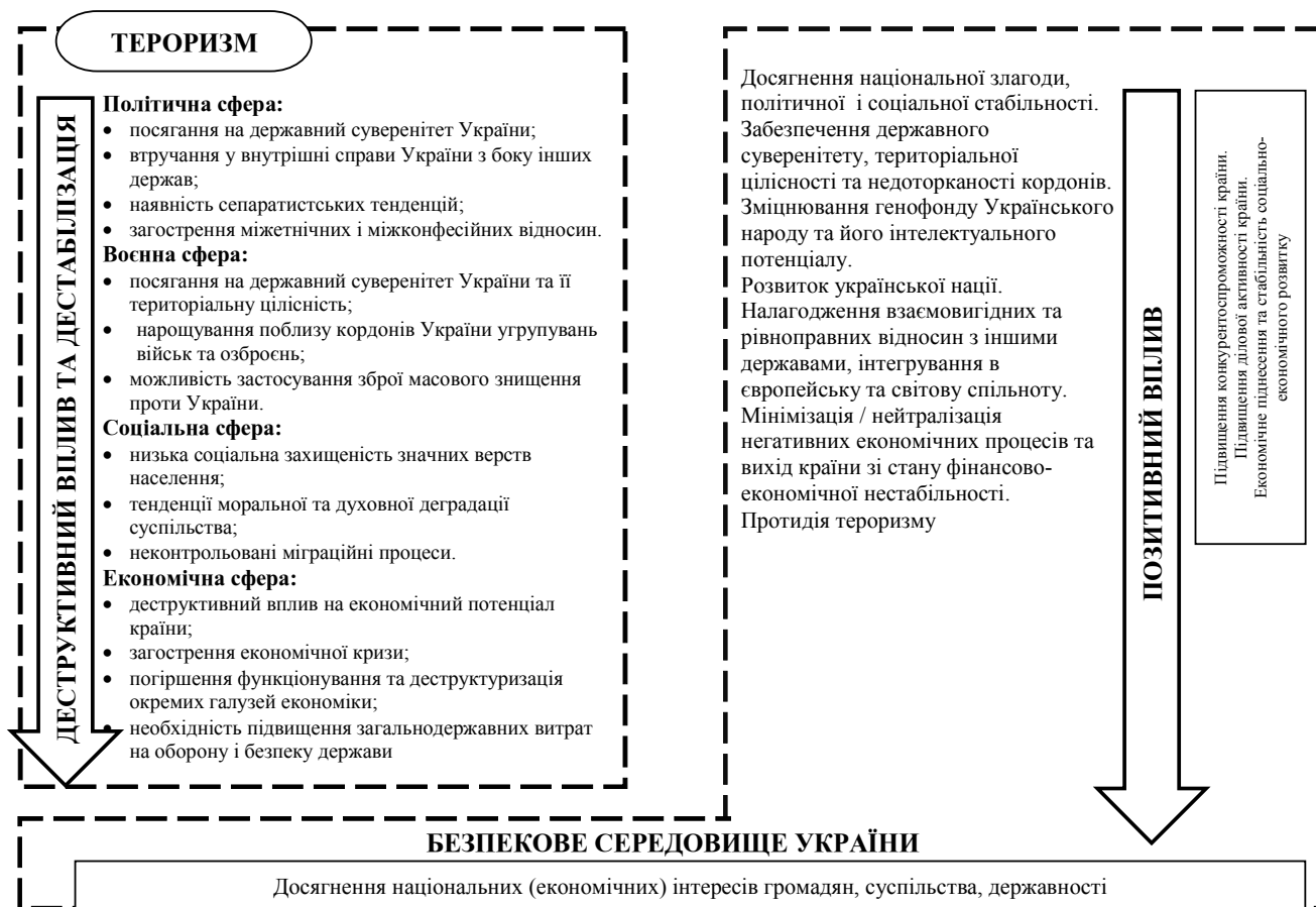
Рис. 2. Безпекове середовище України: деструктивний вплив та заходи досягнення позитивних тенденцій