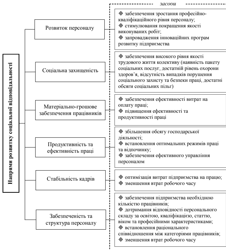
Рис. 1. Напрями та засоби посилення соціальної відповідальності підприємства в Україні

думовою економічною безпекою підприємства, адже характеризує сформованість його інтелектуального та кадрового капіталу, а також ефективність його використання в цілях створення і комерціалізації результатів науково-дослідної та інноваційної діяльності для посилення конкурентоспроможності й підвищення ефективності бізнес-процесів.