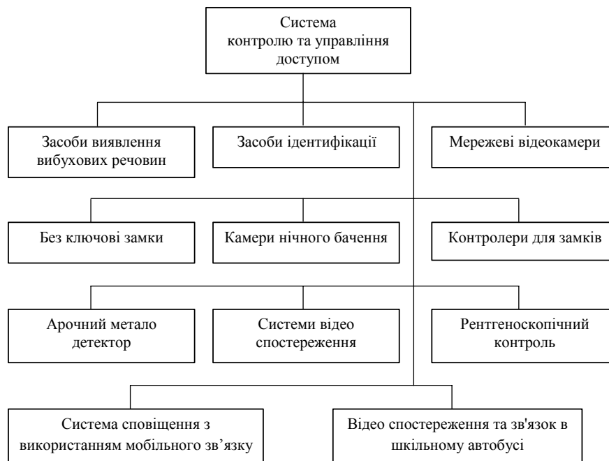
Рис. 2. Елементи системи контролю та управління доступом у системі безпеки ЗВО