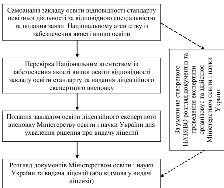
Рис. 2. Схема послідовності дії процедури видачі ліцензії на провадження освітньої діяльності

На неможливість забезпечення рівності при отриманні ліцензії суб'єктами господарювання незалежно від організаційно-правової форми чи форми власності наголошував В. Бахрушин. Щодо університетів застосовується інструмент ліцензування для обмеження конкуренції. Дотримання норм очевидно стає неможливим, якщо орган ліцензу-