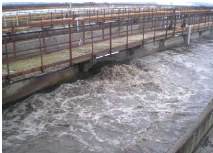
Рис. 3. Повреждение подводной части распределительного трубопровода сжатого воздуха в аэротенке

Имеются резервы понижения и расхода сжатого воздуха. В общей сложности на время выполнения энергоаудита на системе распределения сжатого воздуха насчитывалось 11 утечек сжатого воздуха. Самыми большими потерями сжатого воздуха сопровождаются порывы трубопроводов подводного распределения сжатого воздуха в аэротенках. Пример такого повреждения показан на рис. 3.