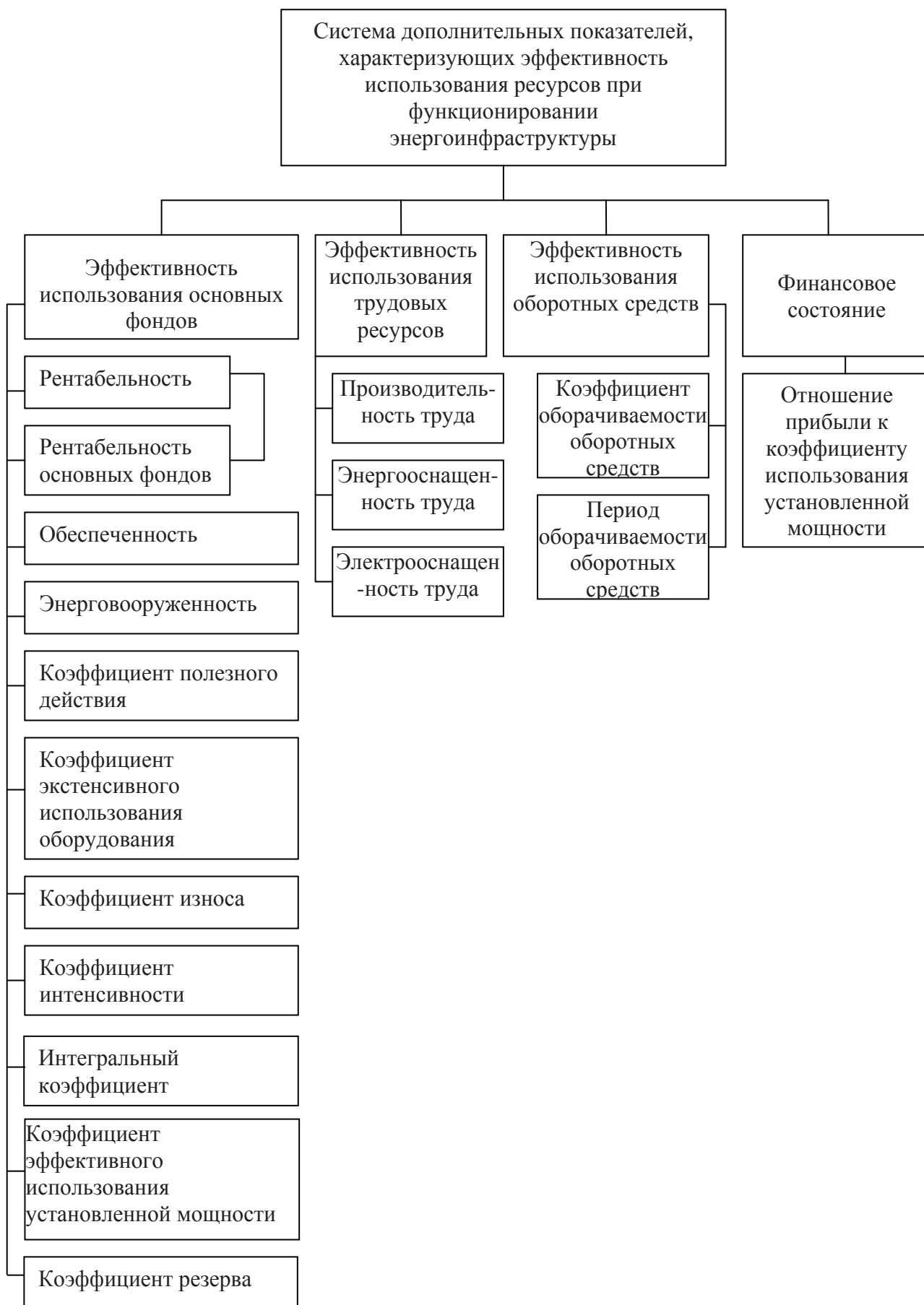
Рис. 3. Структура второго контура системы измерения

Очевидно, что о структуре системы показателей энергоэффективности энергоинфраструктуры и их качественном содержании нельзя судить, по анализу эффективности вообще,