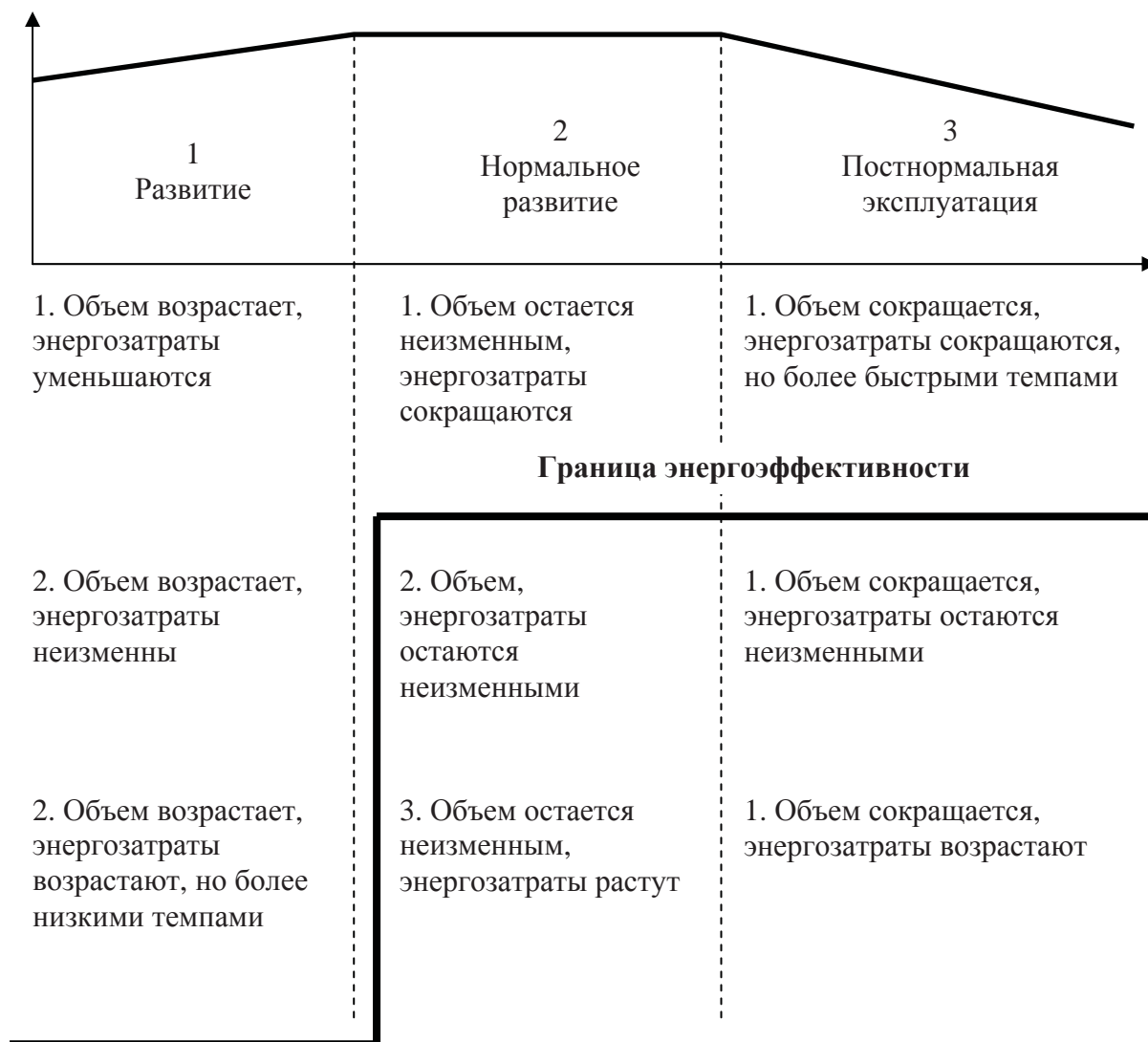
Рис. 1. Влияние границы энергоэффективности энергоинфраструктуры на ее критерии на разных стадиях жизненного цикла предприятия

Центральной проблемой в измерении энергоэффективности энергоинфраструктуры является согласование внешнего и внутреннего аспектов эффективности. Возможны ситуации, когда региональные или экономические внешние интересы могут находиться в противоречии с внутренними интересами конкретного предприятия. Разрешение этого противоречия предполагает максимальное согласование указанных аспектов. Приоритет во всех случаях должен быть отдан внешней эффективности, но при соответствующей компенсации возможного «ущерба». Решение этой задачи в общей постановке лежит в области разработки механизма согласования интересов предприятия с внешними интересами. Важнейшая часть этого механизма – система измерения энергоэффективности энергоинфраструктуры.