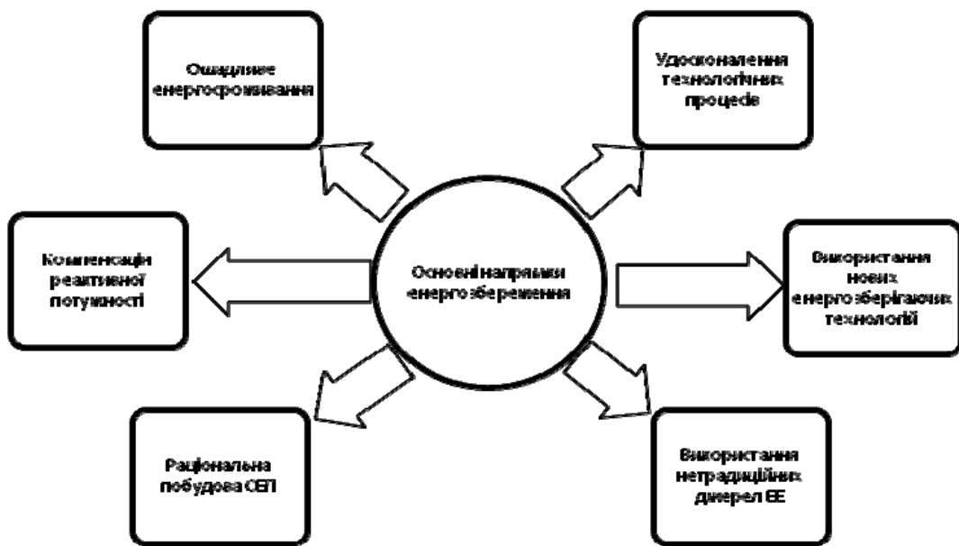
Рис. 1. Основні напрями та шляхи енергозбереження

Теоретичну основу проблеми визначення оптимальних енергозберігаючих заходів становлять відомості про активну й реактивну енергії, що разом становлять повну енергію. При цьому частка активної енергії по відношенню до повної визначається косинусом кута зсуву фаз між струмом і напругою – \cos\phi .