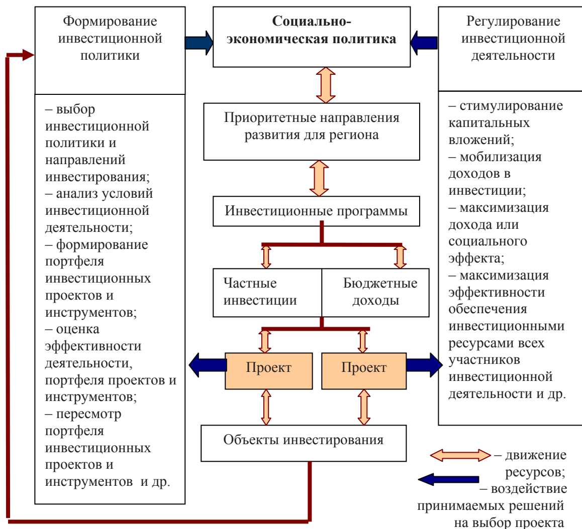
Рис. 2. Схема процесса управления инвестированием в регионе

Кроме основных рычагов, существуют и вспомогательные средства. К ним можно отнести контракты, позволяющие привлечь нужные ресурсы в нужные сроки. Кроме того, для управления ресурсами необходимо обеспечить эффективную организацию работ.