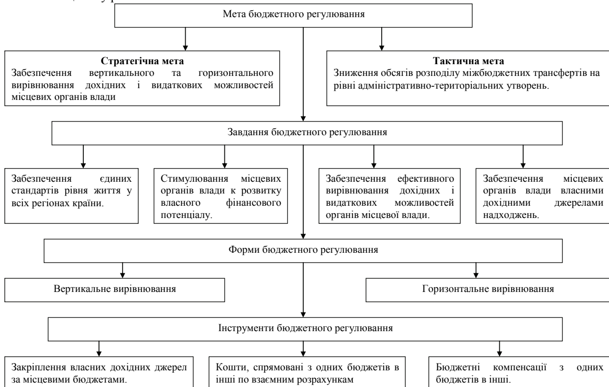
Рис 1. Структура механізму бюджетного регулювання [складено автором]

Створення фондів фінансової та інвестиційної підтримки на рівні територіальних утворень сприятиме зниженню необгрунтованого розподілу централізованої фінансової допомоги, забезпечить ефективність реалізації інвестиційних проектів на рівні територіальних утворень. Значна увага в умовах трансформації економіки України має бути приділена створенню обгрунтованого механізму бюджетного регулювання (рис. 1).