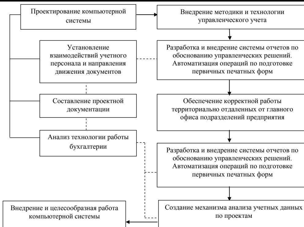
Рис. 3. Алгоритм автоматизации управленческого учета

Вместе с тем, необходимо учитывать и то, что источниками информации управленческого учета могут быть как документы, так и незадокументированные данные. Попытка же попытки автоматизировать последнюю группу данных не увенчалась успехом. Невозможно создать программные пакеты для управленческого учета, которые охватывали бы и учитывали все факторы, влияющие на работу бухгалтеров-управленцев.