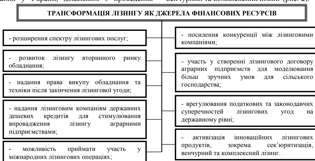
Рис. 2. Трансформація лізингу для фінансування діяльності аграрних підприємств [складено автором]

трансформації лізингу за такими напрямами: розширення спектру лізингових послуг; розвиток лізингу вторинного ринку обладнання; надання права викупу обладнання та техніки після закінчення лізингової угоди; надання лізинговим компаніям державних дешевих кредитів для стимулювання впровадження лізингу аграрними підприємствами; можливість приймати участь у міжнародних лізингових операціях; посилення конкуренції між лізинговими компаніями; участь у створенні лізингового договору аграрних підприємств для моделювання більш зручних умов для сільського господарства; врегулювання податкових та законодавчих суперечностей лізингових угод на державному рівні; активізація інноваційних лізингових продуктів, зокрема сек'юритизація, венчурний та комплексний лізинг (рис. 2).