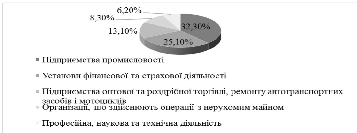
Рис. 2. Галузева структура іноземних інвестицій станом на 2014 рік [сформовано авторами на основі даних [8]]

З даних рис. 2 видно, що найбільший обсяг прямих іноземних інвестицій спрямований в підприємства промисловості і дана умова сприяє зростанню основного капіталу та запровадженню інновацій.