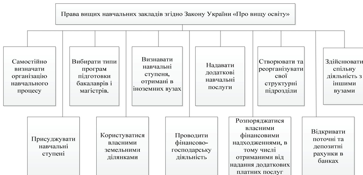
Рис. 1. Права вищих навчальних закладів згідно Закону України «Про вищу освіту»

Отже, побудова національних принципів автономності та самоврядування в Україні сприятиме: