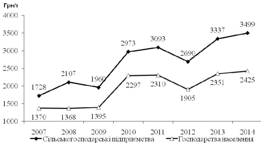
Рис. 1. Середні ціни реалізації молока переробним підприємствам в розрізі

Проте від даної категорії господарств на підприємства надходить недостатня кількість молока – 20,3 %, а від сільськогосподарських підприємств – 91,2%. Населення не зацікавлене у реалізації молочної сировини молокопереробним підприємствам, оскільки реалізаційні ціни молока на ринках вищі від закупівельних цін (рис. 1).