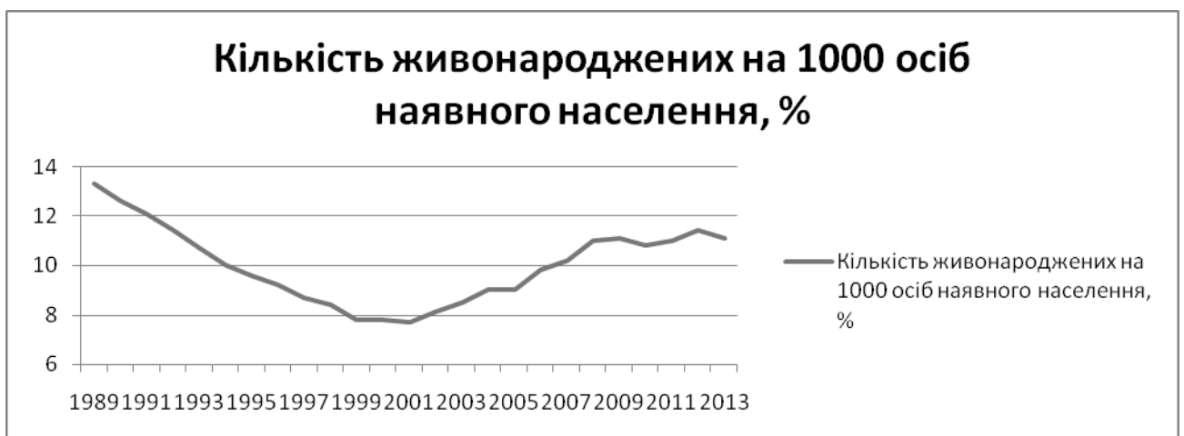
Рис. 3. Кількість живонароджених на 1000 осіб наявного населення (1989 – 2013 рр.) [сформовано автором на основі [8, С. 63]]

державна соціальна політика у сфері народжуваності показувала кращі результати, якщо аналізувати показник народжуваності на 1000 осіб наявного населення. Циклічні коливання усе ж відмічаються, але рівень цього показника складає приблизний рівень 1992 – 1993 рр., тобто заходи державної політики соціального розвитку у цій сфері дали змогу наблизитись до соціального захисту населення та соціальних гарантій, що зберігались в Україні ще від часів Радянського союзу (Рис. 3).