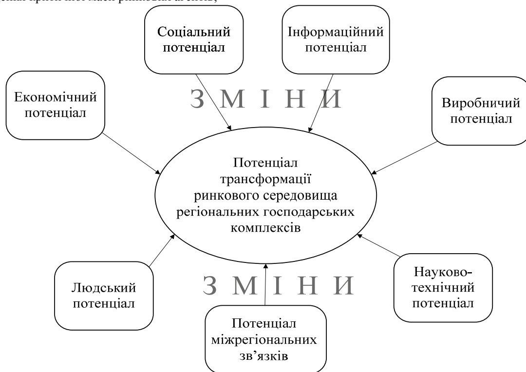
Рис. 2 Схема синергетичного впливу ринкових потенціалів на трансформації регіональних господарських комплексів

Усі визначення питання щодо дослідження ринкового потенціалу не мають реального теоретичного обґрунтування та методологічного визначення у системі української регіональної економіки та практичної апробації в межах українського регіонального менеджменту. Підходи до оцінки розвитку регіональної економіки залишаються неринковими. Вони не є аргументованими з позиції таких первинних категорій як попит, пропозиція, регіональні галузеві ринки, ємність ринку, кореляція ринкових утворень, агломерація ринкових процесів, асиметрія розвитку ринків та інші. Ці питання розглядаються вітчизняними науковцями як теоретичні процеси, а світова ринкова економіка орієнтує свою дослідну діяльність на рівні теорії, аналітичних досліджень, методології, управлінського інструментарію впровадження та контролю (рис. 2).