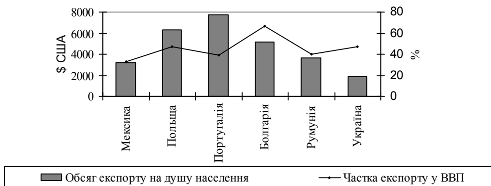
Рис. 1. Частки експорту окремих країн у ВВП та обсяг експорту на душу населення у 2013 р.

В регіонах України спостерігається найбільший розрив між цими показниками. Обсяг експорту на душу населення найнижчий з-поміж досліджуваних країн, частка експорту у ВВП – одна з найбільших (більша – тільки у Болгарії). Перший показник означає, з одного боку, низький попит на українську продукцію за кордоном, з іншого – обмежені можливості виробництва галузей народного господарства та непривабливу цінову політику з боку України. Високе значення частки експорту у ВВП, враховуючи порівняно невеликий обсяг українського експорту, є свідченням, власне, малого показника самого ВВП. В результаті, регіональні підприємства працюють неефективно і виробляють мало, реалізують значну частку виробленого, потенціал внутрішнього ринку майже використаний, тому їх можливості на світовому економічному ринку обмежені і представляють для інших країн незначний інтерес.