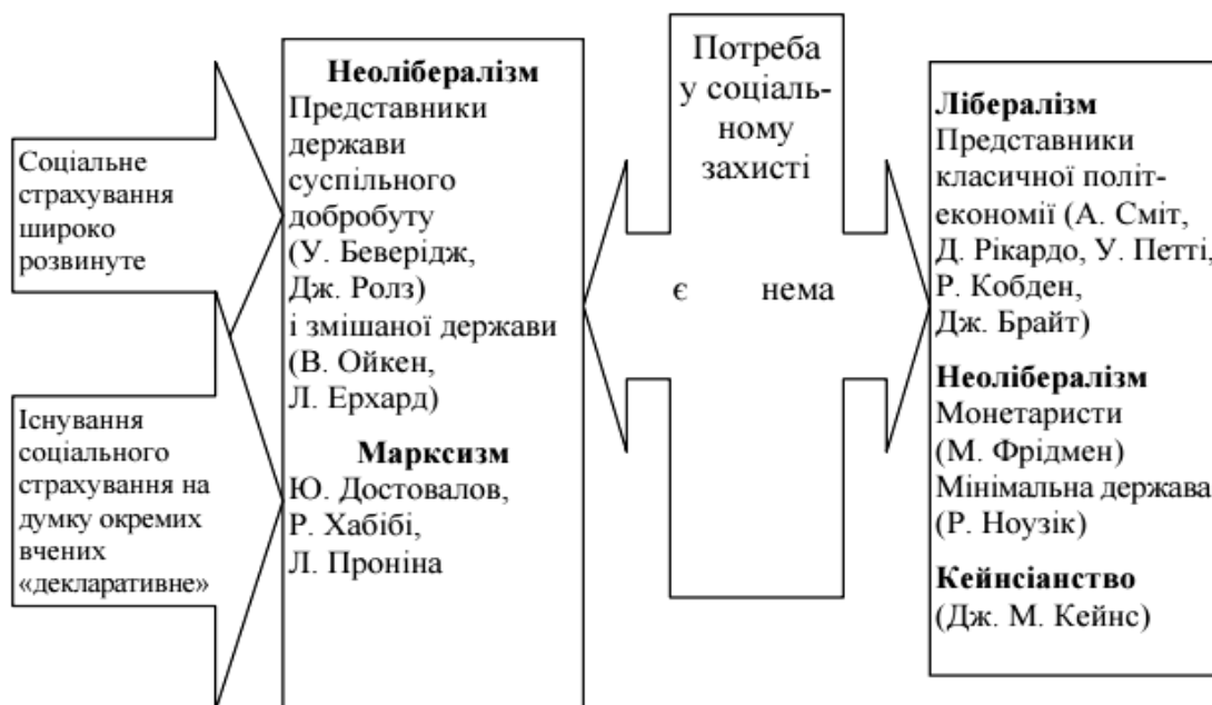
Рис. 1. Групування економічних шкіл за поглядами щодо потреби в соціальному захисті та соціальному страхуванні

економічних систем він характерний, адже доволі часто науковці стверджують, що таке явище властиве лише ринковій економіці. Погляди вчених-економістів у цьому питанні можна розподілити за критерієм існування або відсутності потреби в соціальному захисті. На нашу думку, доцільно виокремити школи лібералізму (класична, неокласична течія, марженалізм, монетаризм) та дирижизму (кейнсіанство, неокейнсіанство), представники яких ставлять під сумнів потребу державного втручання у сфері економічного й соціального життя суспільства. З іншого боку, існують школи марксизму і неолібералізму (змішана держава, держава суспільного добробуту), дослідники яких, навпаки, вважають процеси втручання держави у соціальну сферу не лише необхідними, а й бажаними. Суттєва різниця між ними полягає в тому, що в умовах реалізації політики марксизму існування соціального страхування є більш декларативним, а в умовах побудови соціально орієнтованої (змішаної) держави, навпаки, страхуванню відводиться основна роль (рис. 1).