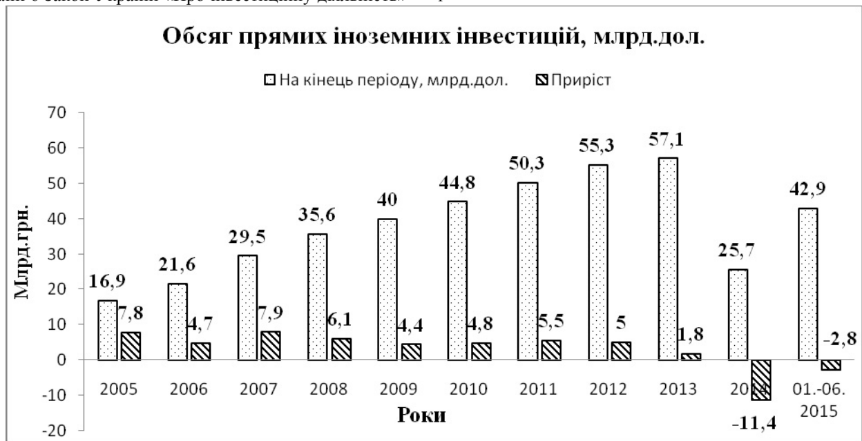
Рис. 1. Обсяг прямих іноземних інвестицій в економіку України, млрд.дол.

За даними Державного комітету статистики в Україні [10] у січні – червні 2015 року в економіку України іноземними інвесторами вкладено 1042,4 млн. дол. США та вилучено 351,3 млн. дол. США прямих інвестицій. Зменшення капіталу за рахунок переоцінки, утрат та перекласифікації за цей період становить 3604,0 млн. дол. США Розглянемо, рис.1.