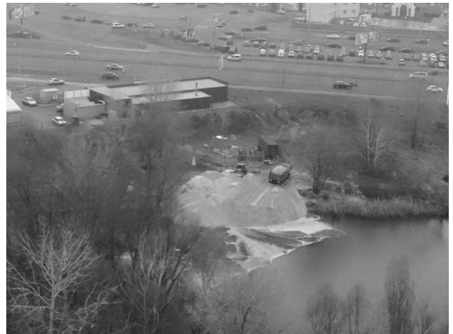
Рис. 4. Підготовчі роботи та роботи з організації благоустрою

І на такий стан не звертають уваги ні представники ЗМІ, ні органи влади. Навпаки, влада намагається вчиняти всілякі перешкоди законному будівництву та роботам з приведення благоустрою озера у належний стан – на фото (рис. 4) підготовчі роботи та роботи з організації благоустрою, виконані власником ділянки ТОВ «Пантера Лтд».