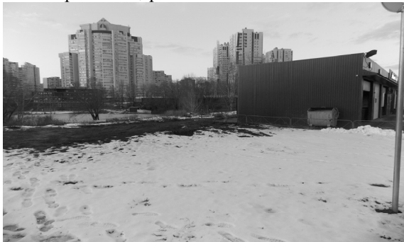
Рис. 1. Автобаня

Із фотофіксацій обстановки навколо озера Срібний Кіл помітні три об'єкти: автомийка (автобаня) (рис. 1), автозаправка "Кло" (рис. 2) та п'ятиповерхова піцерія.