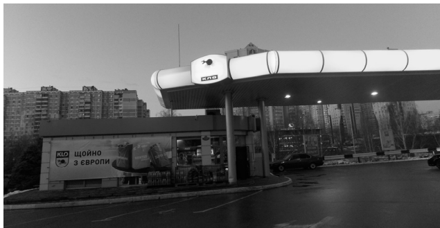
Рис. 2. Автозаправка "Кло"