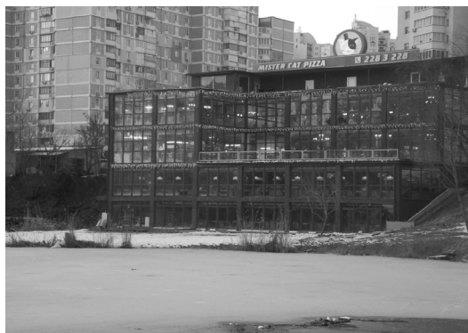
Рис. 3. Піцерія

Відомості щодо документів, які підтверджують правомірність такої забудови – відсутні. Зауважимо, що ці об'єкти знаходяться на інженерних коридорах, де категорично заборонено їх розташування.