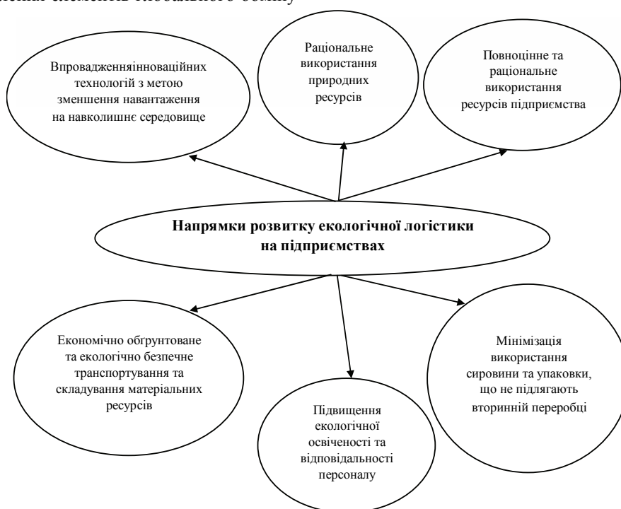
Рис. 1. Основні напрямки розвитку екологічної логістики на підприємствах [складено на основі [2]]

Тому, вважаємо за необхідне виділити ряд політичних та економічних інструментів для зменшення викидів вуглекислого газу транспортом, що використовується у логістичній сфері (рис. 2).