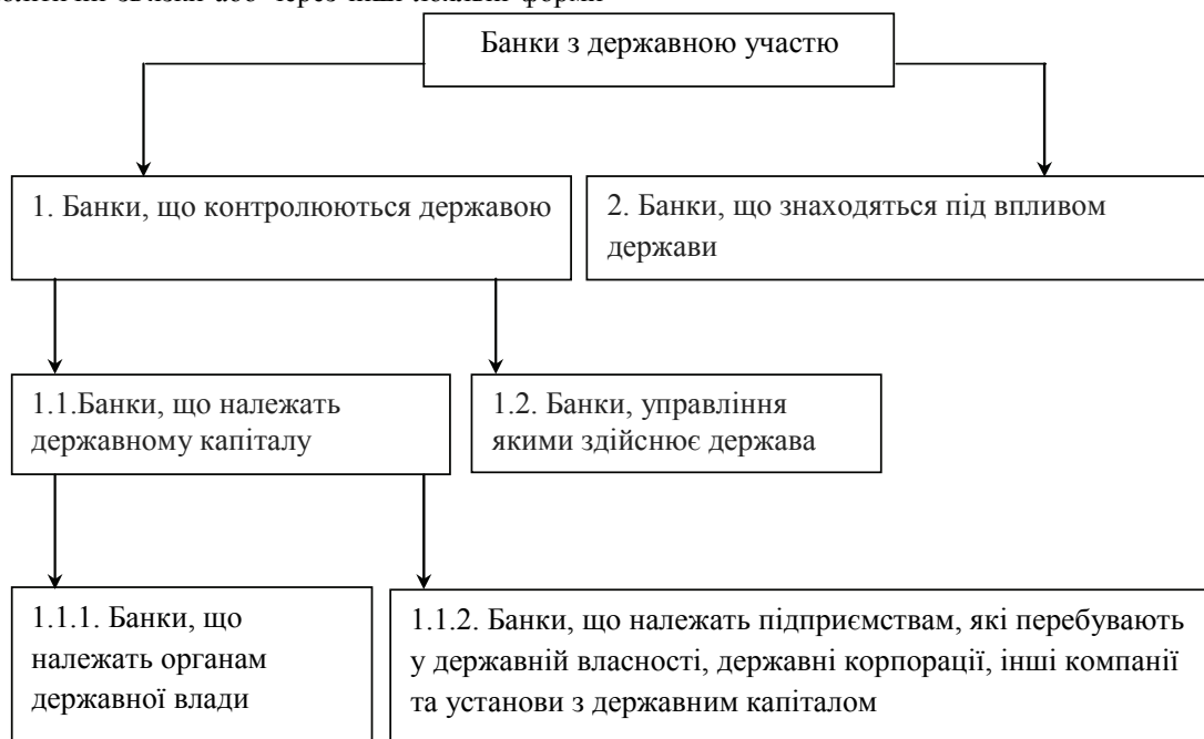
Рис. 2. Класифікація банків, що знаходяться під впливом держави [2]

Окремо виділяється категорія банків, управління якими здійснює держава. У таких установах держава та її органи, навіть при відсутності контрольного пакету акцій, здійснюють істотний вплив на прийняття ключових рішень через механізми корпоративного управління.