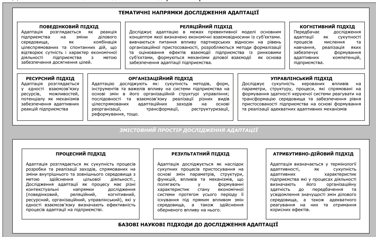
Рис. 3. Упорядкування наукових підходів до визначення економічного змісту адаптації підприємства [авторська розробка]

ства за умов посилення невизначеності, динамізму та складності ділового середовища, актуалізуються процеси змін параметрів, структури, функцій, керованих впливів, тощо, які визначаються здатністю реалізувати властивості та характеристики, які підприємство набуває, у тому числі, і у процесах попередньої діяльності, що у цілісному розумінні характеризується як розвиток.