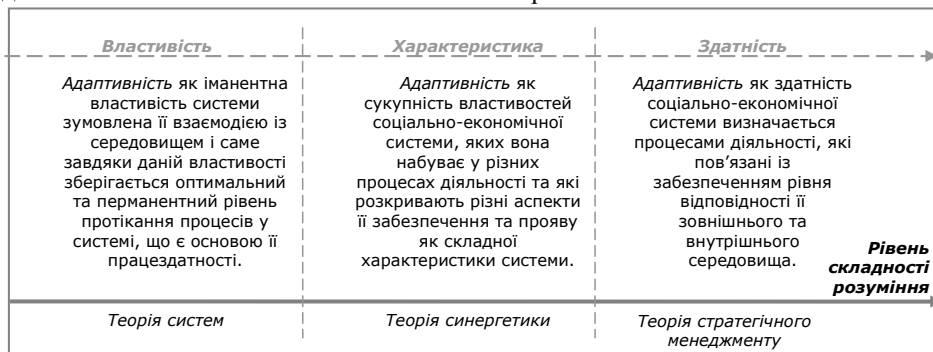
Рис. 1. Формалізація змістовного наповнення терміну «адаптивність» підприємства у науковому дискурсі [розроблено автором]

У такій змістовній постановці адаптивність як організаційна здатність, є більш складною інтерпретацією її як властивості та характеристики, які набувають визначеності у процесах діяльності, що пов'язані із забезпеченням рівня відповідності зовнішнього та внутрішнього середовища соціально-економічної системи. Формалізоване представлення авторської логіки взаємозв'язку категорій, що визначають адаптивність підприємства узагальнено та формалізовано на рис. 1.