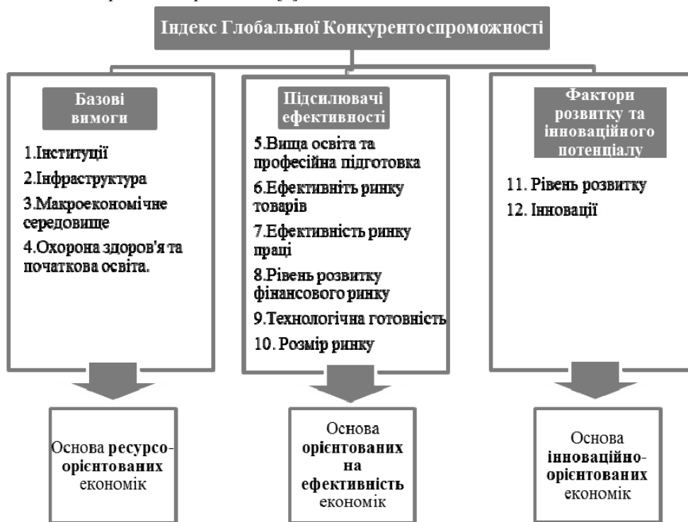
Рис. 1. Структура Індeksu Глобальної конкурентоспроможності

GCI об'єднує 114 показників, які мають значення для підвищення продуктивності і довгострокового процвітання. Ці показники згруповані в 12-ть складових (див. рис. 1). Складові, в свою чергу, розділені на три субіндекси: базові вимоги, підсилювачі ефективності, а також фактори розвитку та інноваційного потенціалу.