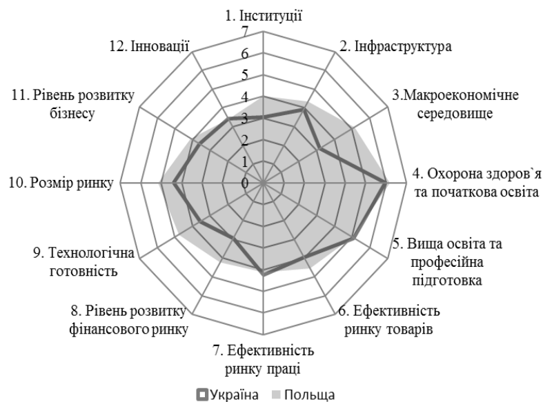
Рис. 4. Порівняння результатів України та Польщі у відповідності до Звіту глобальної конкурентоспроможності 2016/2017

Ці реформи були проведені у досить стислий проміжок часу та достатньо ефективно. У відповідності до звіту про глобальну конкурентоспроможність 2016/2017 Україна, порівняно з Польщею, суттєво відстала по показнику «Макроекономічне середовище» з значенням 3,17 проти значення 5,14, що має Польща. Також значної уваги потребують й інші складові, такі як: «Рівень розвитку фінансового ринку», «Технологічна готовність» та «Інституції». Тому впровадження нової податкової системи (модернізація податку на доходи та ПДВ), стимулювання розвитку фінансового ринку та ринку капіталів (реструктуризація