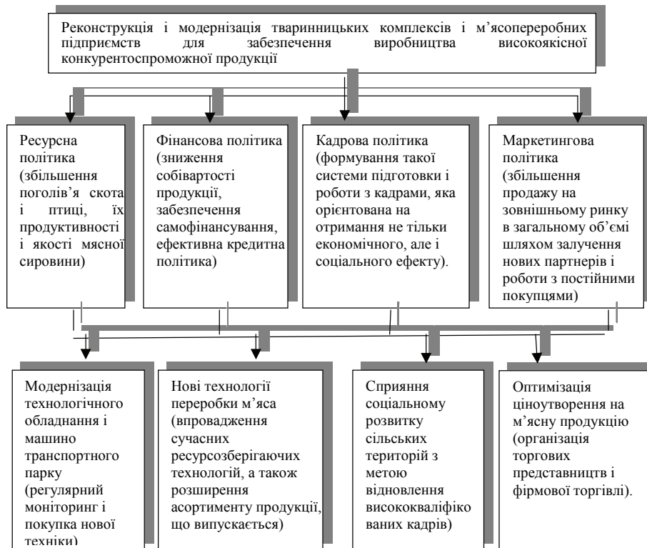
Рис. 2. Напрями реалізації стратегічних цілей регіонального м'ясопродуктового комплексу [власна розробка автора]