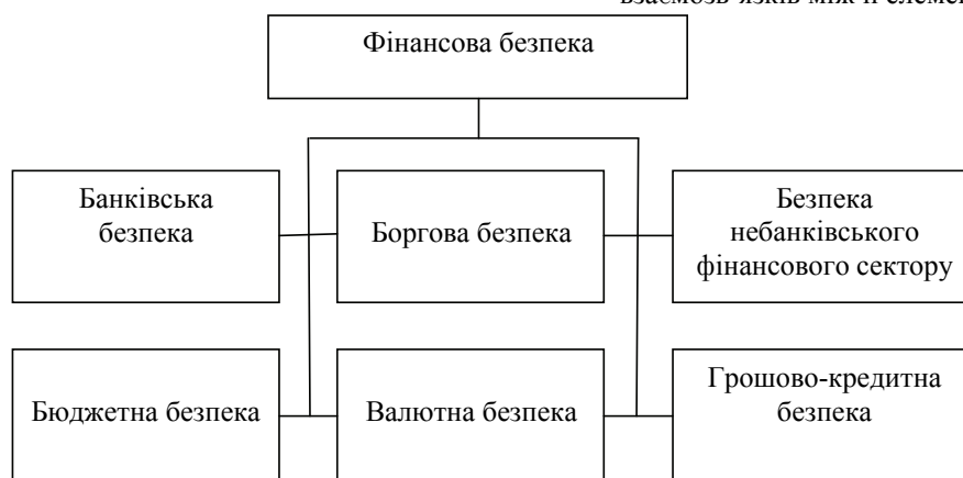
Рис. 1. Складові фінансової безпеки [складено на основі [3]]

У [3] запропонована структура фінансової безпеки, яка, на нашу думку, достатньо повно розкриває сутність та можливий характер взаємозв'язків між її елементами.