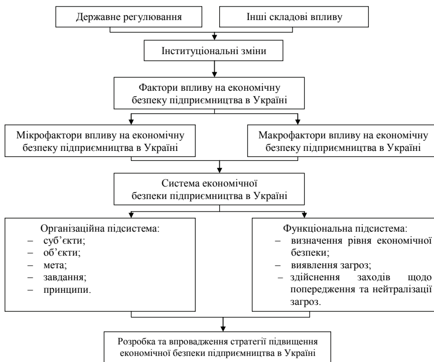
Рис. 1. Роль та місце державного регулювання інституціональних змін у системі економічної безпеки підприємництва в Україні [складено автором на основі джерел: [15, 16, 17]]

Спираючись на дослідження О.В. Лютої і Н.Г. Пігуль [15], Т.Г. Васильців [16], О.Б. Жихор і Т.М. Куценко [17] на рисунку 1 наведемо роль та місце державного регулювання інституціональних змін у системі економічної безпеки підприємництва в Україні.