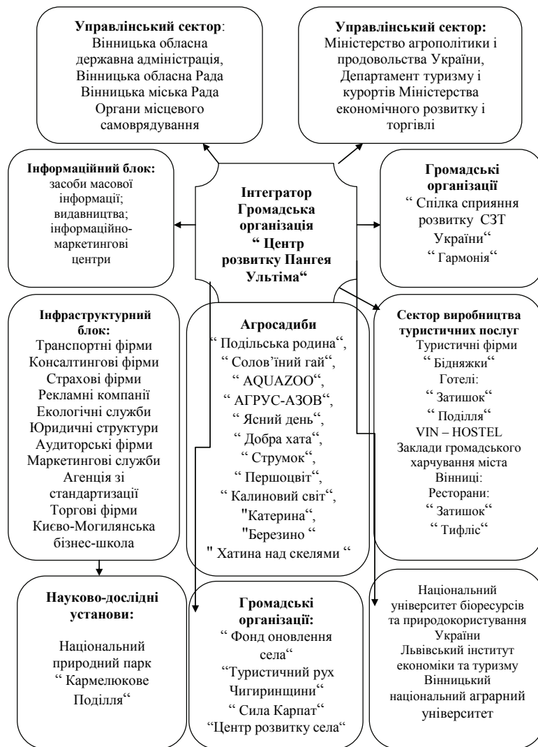
Рис.1. Проектна модель взаємовідносин в туристично-рекреаційному кластері [розроблено автором]

У той же час розподіл праці, його спеціалізація, також передбачає кооперацію, оскільки одне витікає з іншого. На цій основі базується взаємозв'язок і взаємозумовленість процесів спеціалізації, кооперації, концентрації, які об'єктивно відбуваються, а звідси – інтеграції і розміщення виробництва.